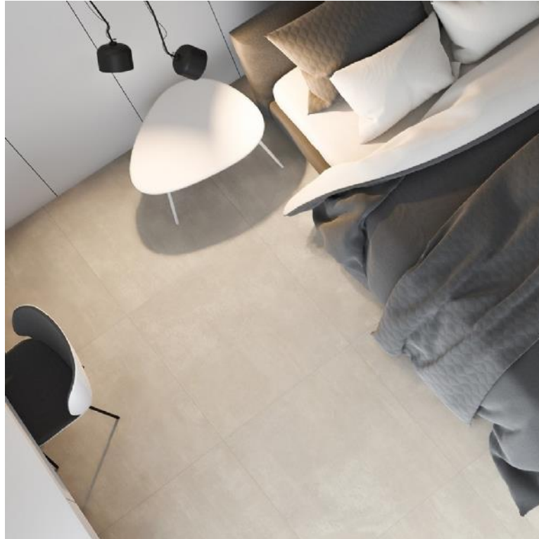
IMAGEM DO PORCELANATO EM AMBIENTE MODELADO