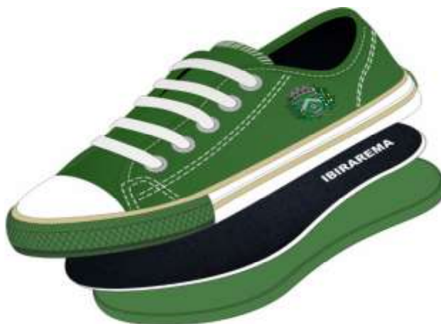
Vista externa (Foto Ilustrativa)

1. Por se tratar de um produto em produção fabril, exige-se que as dimensões dos calçados acompanham os padrões comerciais baseados na escala francesa cujo fator de conversão é 0,66667 centímetros de número a número. A medida realizada em calçado já confeccionado deverá ser efetuada na palmilha amortecedora ou palmilha de overloque, com variação permitida de 3% (+/-). Deve ter o Brasão do órgão aplicado na lateral do tênis. A marca da amostra deverá ser a mesma constante na proposta de preços junto com os laudos e consequentemente deverá permanecer inalterada durante toda a vigência da ata de registro de preços, sob pena de desclassificação e/ou cancelamento da ata.