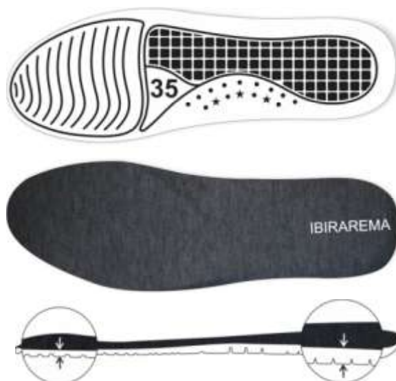
Palmilha amortecedora (Foto Ilustrativa)

10 - SOLA Peça integrante da base inferior do calçado. Deverá ser fabricado em “PU”, Poliuretano poliéter de alta resistência a hidrólise. Este solado deve ser na cor Verde semelhante ao Pantone 18-0125 TPX, devendo ter a gravação da numeração em todos os tamanhos de forma permanente, e formato antiderrapante, similar à ilustração abaixo. E na sua base deve acompanhar o perfil da forma e ser em formato de cunha, com espessura dianteira ( Espessura A ) 5 milímetros, e espessura traseira ( Espessura B ) 9 milímetros, tolerância admitida +/- 1 milímetro, isso deve ser seguido em todos os tamanhos.